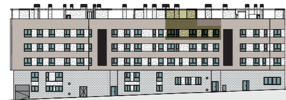
ALZADO FACHADA C/ ENRIC VALOR