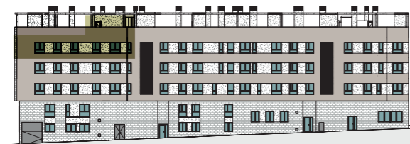
ALZADO FACHADA C/ ENRIC VALOR